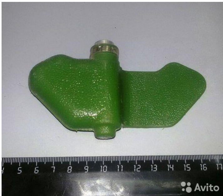
«Мина – ЛЕПЕСТОК» в боевом положении на земле (присыпана грунтом):